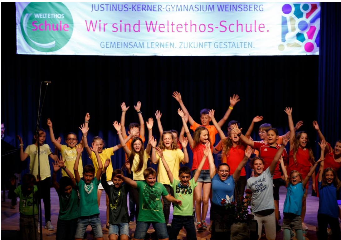
Unsere Fünftklässler führen ihr Projekt Body and Rhythm vor

Werteerziehung auch in übergreifenden Kontexten. Die musikalischen Darbietungen unserer Chöre und Orchester rundeten die Auszeichnung ab. Schön war dabei, dass beim Festakt die jüngsten Mitglieder unserer Schulgemeinschaft besonders im Mittelpunkt standen: unsere Fünftklässler zündeten im Projekt Body and Rhythm ein musikalisches Feuerwerk und schlugen den Bogen zum gelebten Weltethos am JKG mit Musik, Bewegung, Gemeinschaft und Lebensfreude.