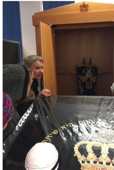
Eindrücke unserer Besuche in den verschiedenen Gotteshäusern

Im benachbarten Ort Obersulm-Willsbach gibt es einen buddhistischen Tempel, der jedes Jahr einen großen Tag der offenen Tür veranstaltet. Mit der sogenannten Kathina-Zeremonie bekommen die Mönche neue Gewänder. Da diese Zeremonie an einem Sonntag stattfindet, konnten wir nicht im Unterricht mit der Schulklasse hingehen. Aber zwei Schüler der Klasse 10 haben die Zeremonie im Oktober für uns besucht, Fotos gemacht und mit einer Präsentation in der Schule die ganze Klasse daran teilhaben lassen.